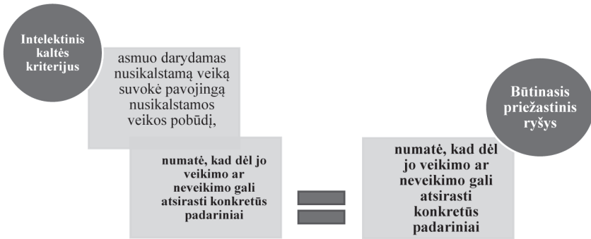
1 pav. Būtinasis priežastinis ryšys patenka į intelektinio kaltės kriterijaus turinį

Sugretinus būtinojo priežastinio ryšio ir intelektinio kaltės kriterijaus turinį, pagrindžiamas prieš tai pateiktas teiginys, jog šių elementų turinys identiškas. Todėl juridinės technikos prasme Lietuvoje teisiškai reikšmingu laikomas būtinasis priežastinis ryšys yra kaltės intelektinio kriterijaus sudėtinė dalis. Adekvataus priežastinio ryšio teorija ir jos nustatinėjimo metodika yra subjektyvaus pobūdžio. Todėl akivaizdu, jog kyla poreikis esamą adekvataus priežastingumo teoriją keisti kita teorija, atitinkančia objektyvų priežastinio ryšio pobūdį.