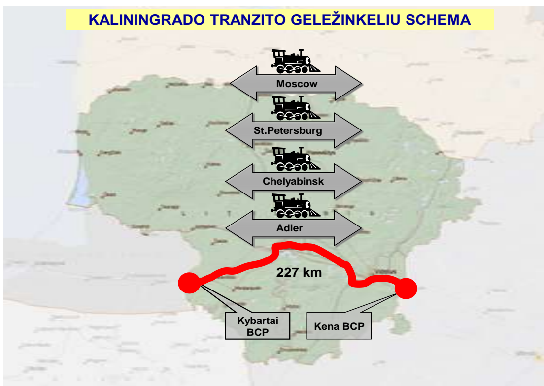
1 pav. Kaliningrado tranzito geležinkeliu schema

Tranzito traukiniu maršrutas eina per teritorijas, kurias prižiūri Vilniaus rajono, Trakų rajono, Elektrėnų rajono, Kaišiadorių rajono, Kauno rajono, Prienų rajono, Kazlų Rūdos, Vilkaviškio rajono, Vilniaus miesto, Kauno miesto, Marijampolės miesto policijos komisariatai (1 pav.).