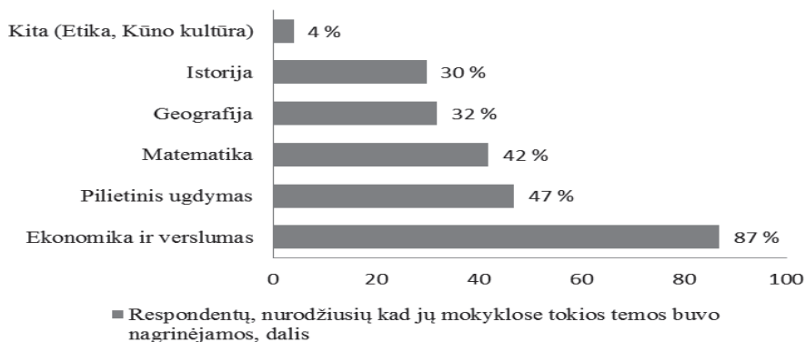
3 pav. Mokomieji dalykai, kuriuose buvo nagrinėjamos su mokesčių raštingumu susijusios temos

Atsakant į klausimą, kaip vertina šias mokyklose vykusias veiklas, respondentų nuomonės pasiskirstė beveik tolygiai, t. y. 48,4 proc. nurodė, kad veiklos jiems patiko, jie gavo reikiamų žinių ir įgūdžių, o šiek tiek didesnė dalis, t. y. 51,5 proc. nurodė, kad nuomonės neturi arba veiklos jiems nepatiko. Ši tendencija leidžia daryti prielaidą, jog mokinių pasitenkinimas esamomis mokesčių raštingumo ugdymo priemonėmis, jų praktiniu taikymu, veiklų pobūdžiu nėra aukštas. Apklaustos metu taip pat analizuota (3 pav.), kokio dalyko renginiuose (pamokose) bei kokius konkrečiai mokesčių raštingumo aspektus mokykloje nagrinėjo respondentai. Didžioji respondentų dalis, nurodydami mokomuosius dalykus, susijusius su mokesčių raštingumo ugdymu, akcentavo ekonomiką ir verslumą (87 proc.), pilietinį ugdymą (47 proc.) ir matematiką (42 proc.):