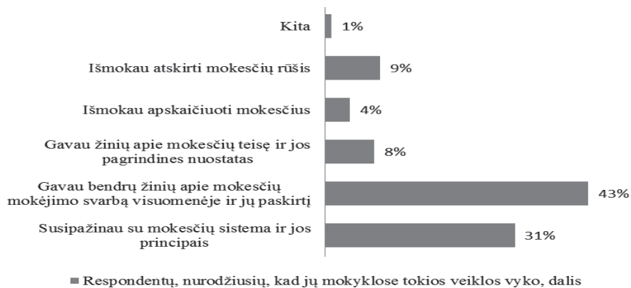
2 pav. Su mokesčiais susijusios žinios ir įgūdžiai, įgyti mokyklose vykusių veiklų metu

Iš respondentų, nurodžiusių, kad jų baigtose mokyklose vykusiose veiklose buvo nagrinėjamos temos, susijusios su Lietuvos mokesčių sistema ir mokesčių mokėjimu, net 69,1 proc. nurodė, kad tokios temos buvo nagrinėjamos 11–12 klasėse, o likusi dalis akcentavo, jog šias temas nagrinėjo 8–10 klasėse. Ši respondentų grupė nurodė, kad didžiąją su mokesčių raštingumo ugdymu susijusių temų dalį jie nagrinėjo pamokų (30,7 proc.) ir pasirenkamųjų dalykų metu (10,4 proc.). Tokia tendencija iš esmės atitinka situaciją, apibrėžtą Bendrosiose ugdymo programose, kuriose numatytas mokesčių apraiškų įtraukimas būtent į privalomų dalykų pamokų bei pasirenkamųjų dalykų pamokų turinį (8–10 bei 11–12 klasės, žr. 1 lentelę). Šių veiklų metu įgytų žinių ir įgūdžių pasiskirstymas pateikiamas 2 paveiksle: